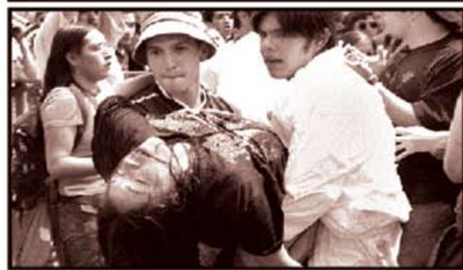
Arriba, aspecto de la plaza del Zócalo. Abajo, izquierda, los aferrados de primera fila y una fanática desmayada. A la derecha, los cantantes Federico Fog y Saúl Hernández.