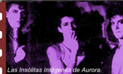
Las Insólitas Imágenes de Aurora.

Mientras las Insólitas Imágenes de Aurora sigan en el baúl de los recuerdos, siempre existirán en los corazones de esos fans, que más que curiosos desenterradores de reliquias legendarias, se encontraran con este demo en el clásico tianguis del chopo, el cual les deleitara los oídos y las entrañas. Y si me preguntas que calificación le doy a este material yo creo que es un 10 y tú ¿Qué calificación le pondrías?, ahí te lo dejo de tarea para que lo consigas y me digas sino es un material que vale el 100%.