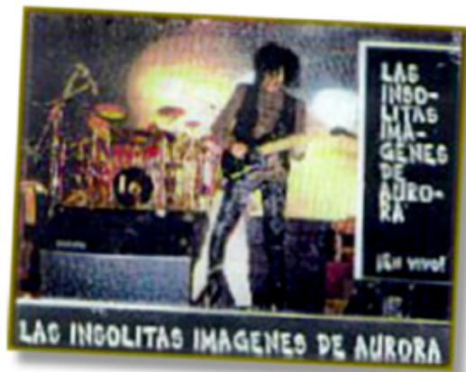
Las Insólitas Imágenes de Aurora, demo grabado en 1986.