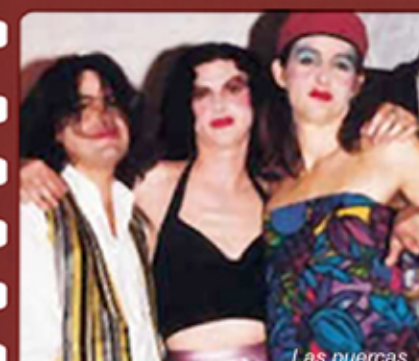
Las Insólitas Imágenes de Aurora.