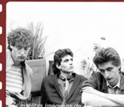
Las Insólitas Imágenes de Aurora.