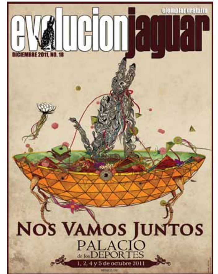
ARTE EN ESTAS DOS PORTADAS POR MAURO HIDALGO, GRACIAS!

Significo conexion..conocer...saber..acercarse..sentir a toda la gente que de alguna manera sabe compartir!la esencia de Caifanes y Jaguares!y gracias a ti Richi y gracias a Revista Evolucion Jaguar por brindarnos esa arma!esa puerta!de dar donar relatos, vivencias!de todos los que conformamos esta alianza!!los que nos hace ser... un aliado..saludos!y suerte!en proyectos venideros!